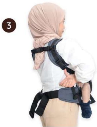
Longgarkan strap bawah ketiak