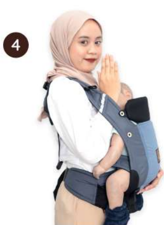
Keluarkan tangan dari padding bahu kanan