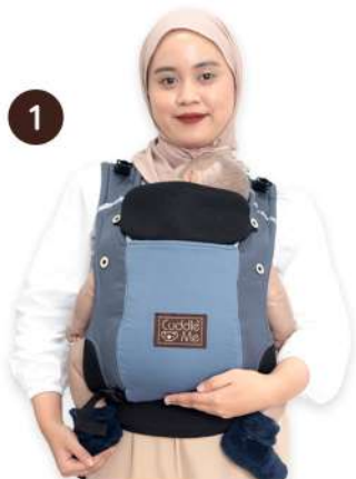
Gendong bayi dalam posisi Front Facing-In

Bayi boleh di gendong samping saat bayi memiliki kontrol leher dan kepala yang baik dan dapat duduk secara alami pada posisi kaki katak/M-Shape. Gendong samping ideal untuk bayi yang lebih besar, bayi bisa melihat dunia dan lebih nyaman untuk belajar hal baru