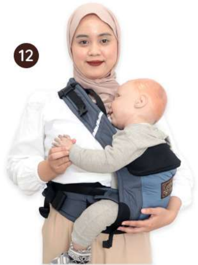
12 Anda siap menggendong hip carry dengan aman dan nyaman