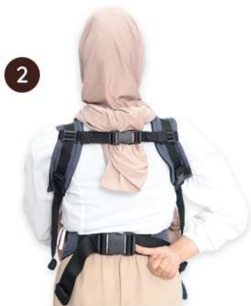
Longgarkan strap pinggang