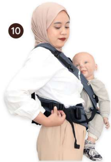
10 Pasang buckle pada padding yang melingkari pinggang