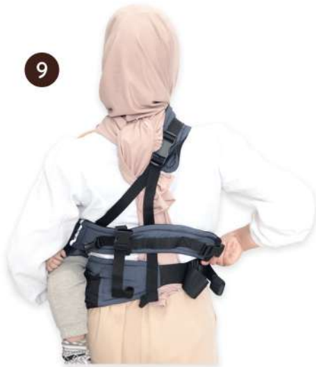
9 Lingkarkan sisa padding ke pinggang