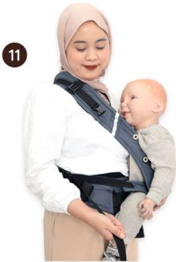
11 Tarik dan kencangkan strap