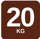
3,2kg - 20kg